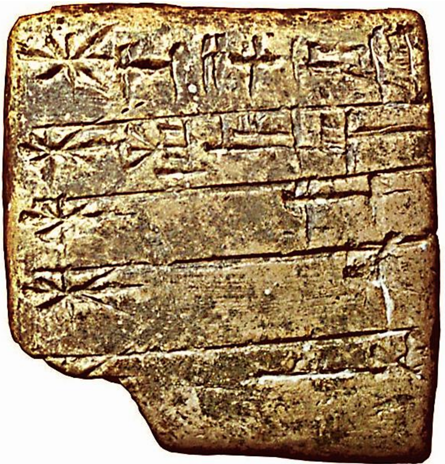
JMÉNA SUMERSKÝCH BOHŮ