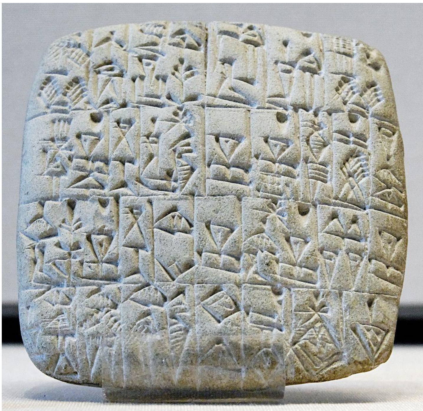
SMLOUVA NA PRODEJ DOMU