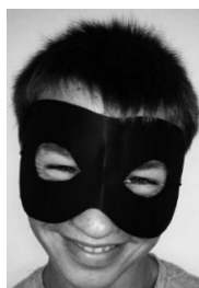
Agent BUCHO A RAFA