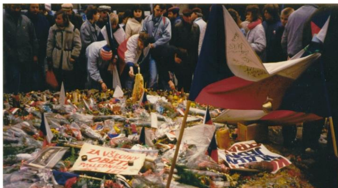
Sametová revoluce na Václavském náměstí

Rok 1989 -Studenti se začali bouřit a pořádat demonstrace. A tak komunistický režim padl! Pojem sametová revoluce vymysleli novináři a označili tak naši revoluci, jejíž nejvýraznější osobností byl Václav Havel.