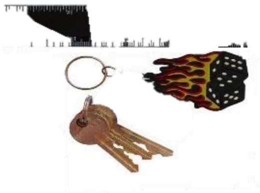
HRY O KLÍČ