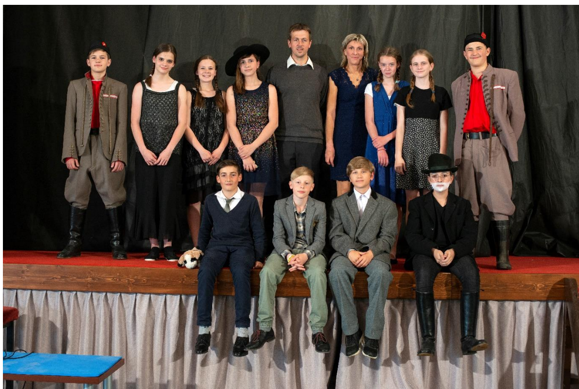
Osobnosti první republiky