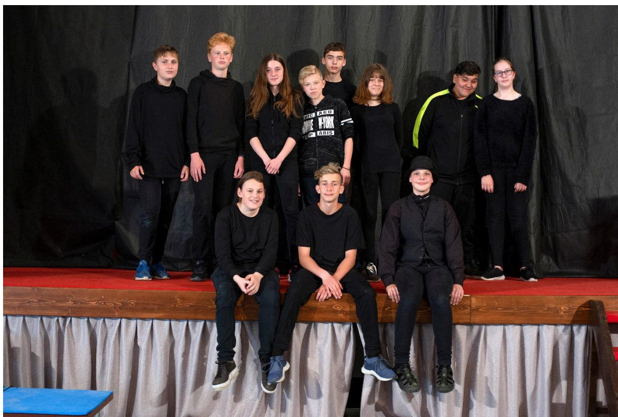
Kulisáci a pravé ruce režie