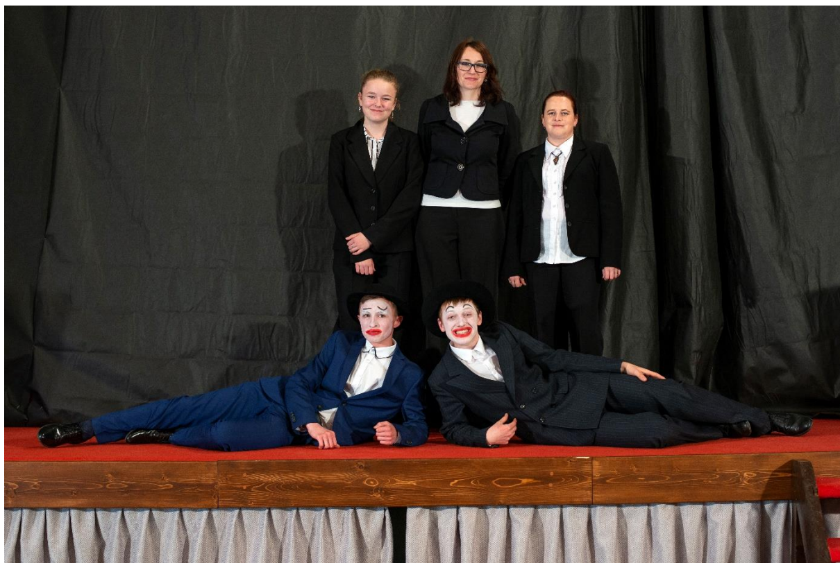
Forbíny Voskovce a Wericha