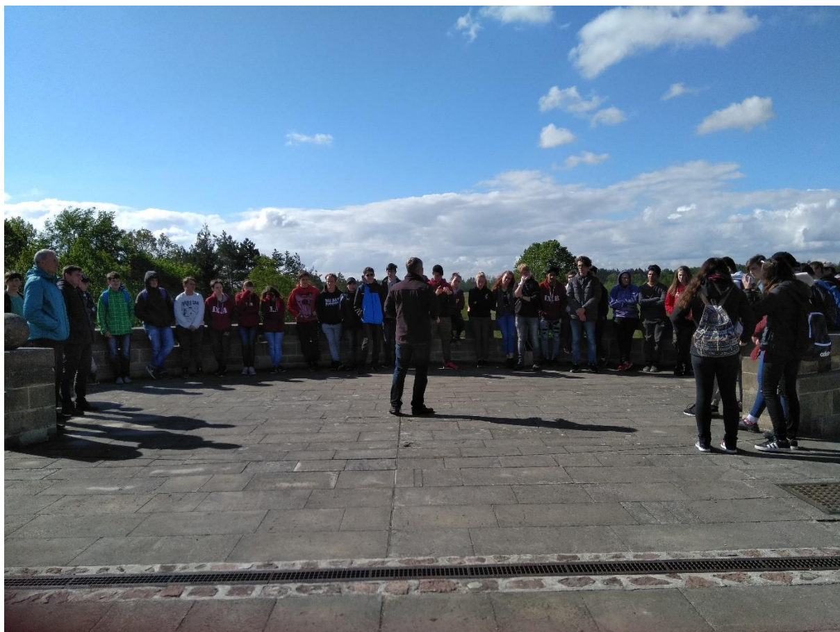
památník Lidice – za ním pohled na planinu původních Lidic