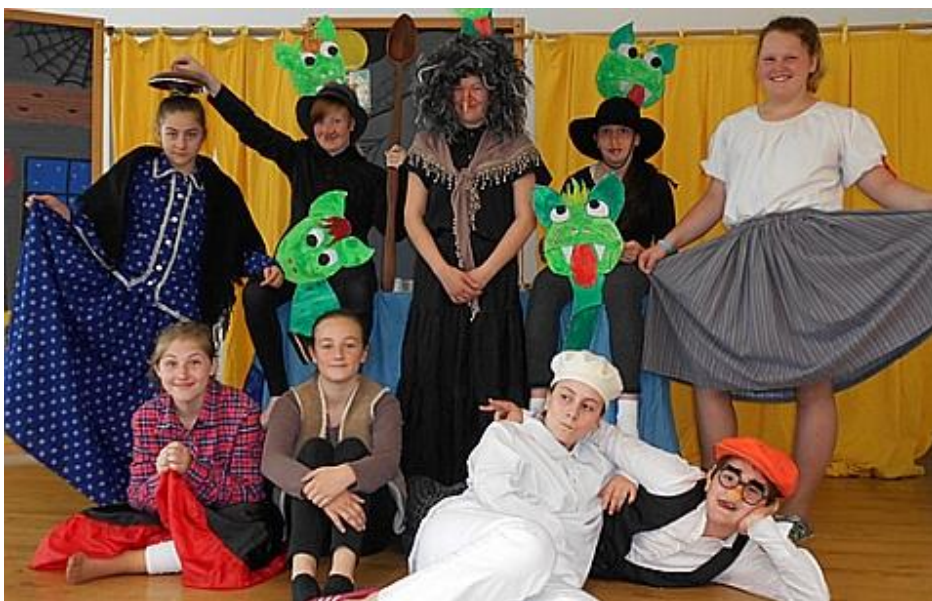
O nosatě čarodějníci – divadelní představení