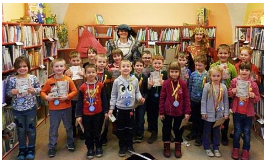
Prvňáčci v knihovně