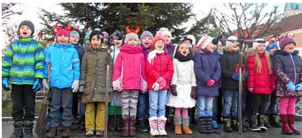
Zpívání u vánočního stroměčku na náměstí