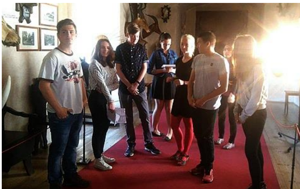
Provázení na zámku