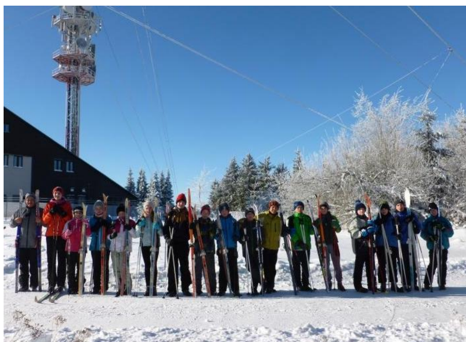
Lyžařský kurz na Řásné