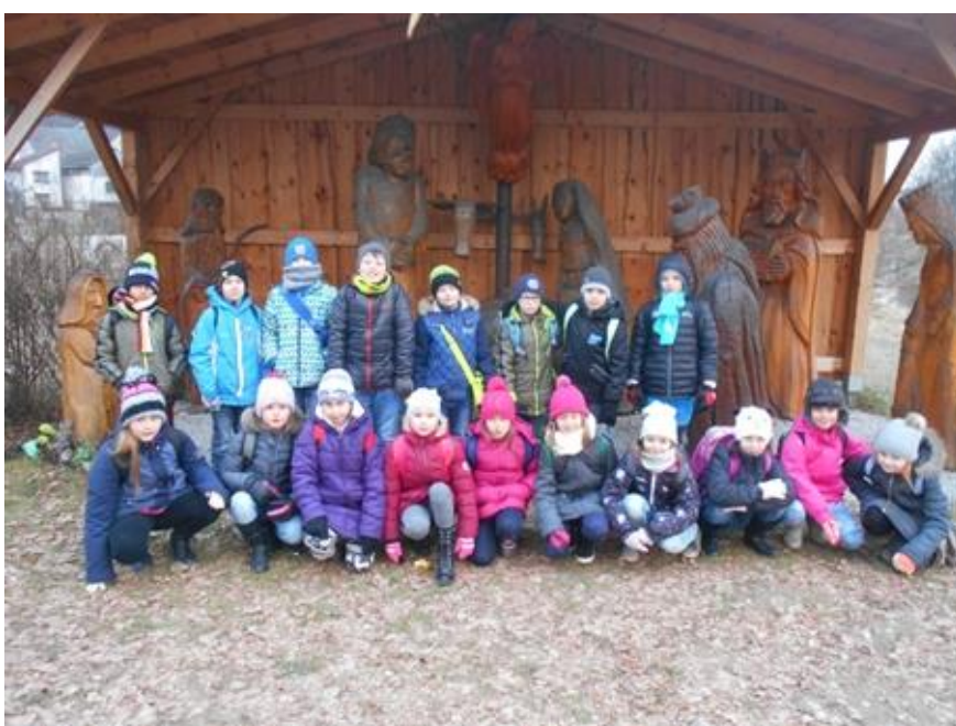
Betlémy v Třešti