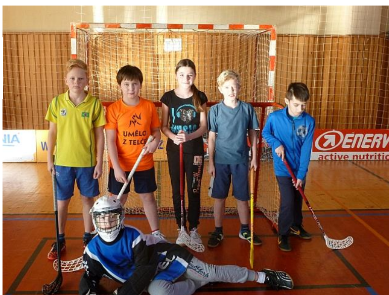
Florbal - školní turnaj mladších žáků