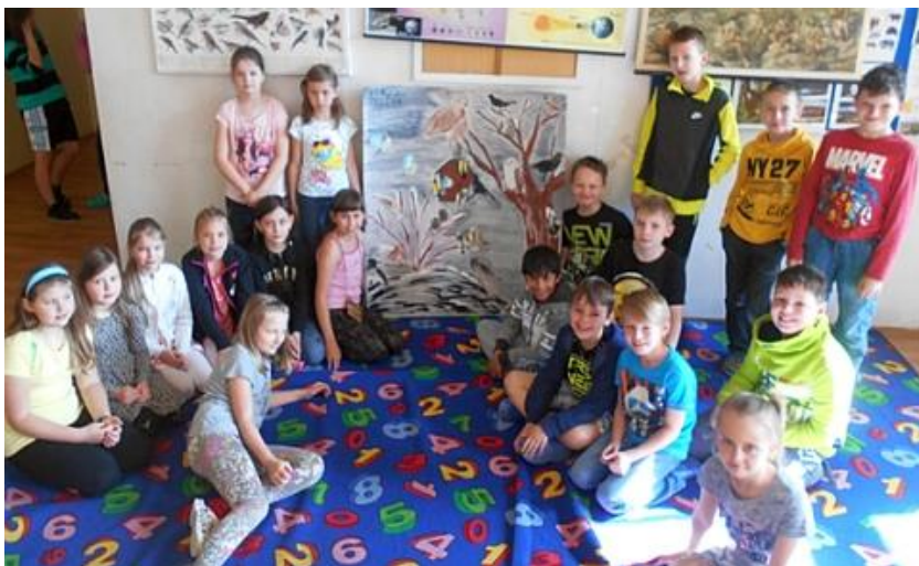
Práce na projektech