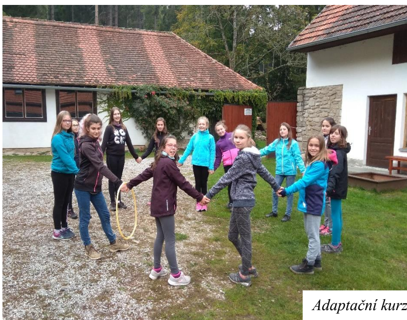
Adaptační kurz 6. A