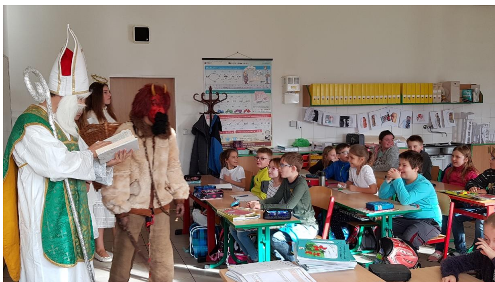
Mikuláš v ZŠ