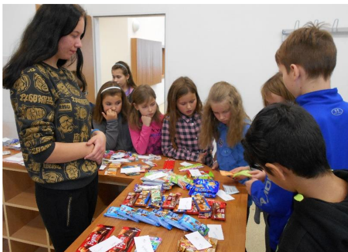
Projekt – finanční gramotnost