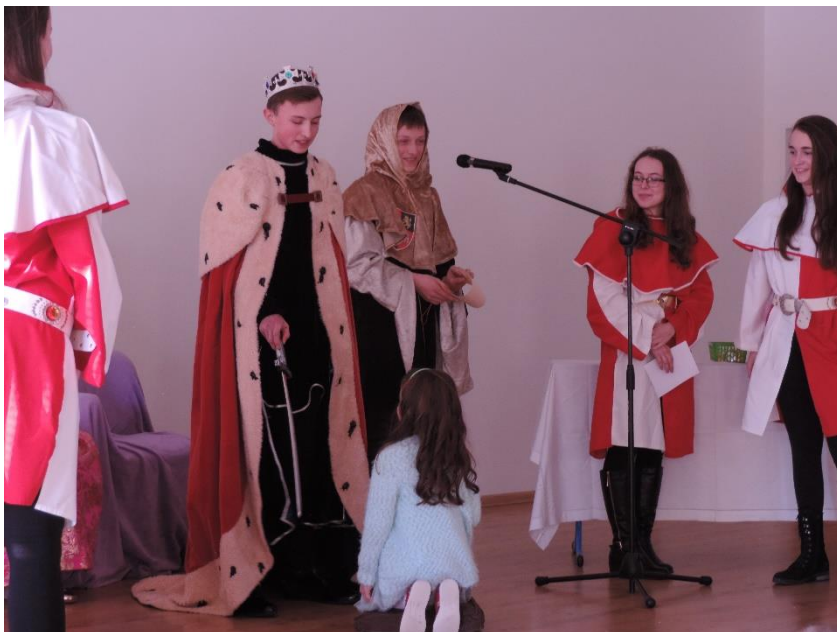
Pasování prvňáčků na čtenáře