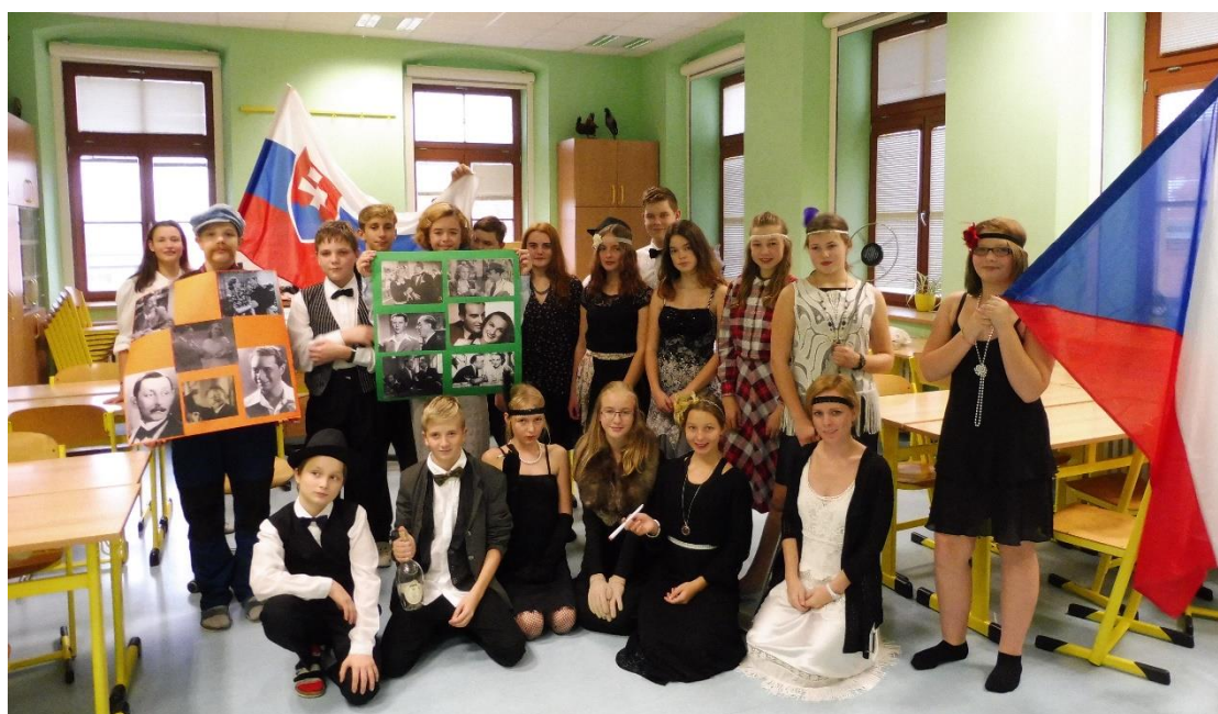
Projekt – 100 let republiky