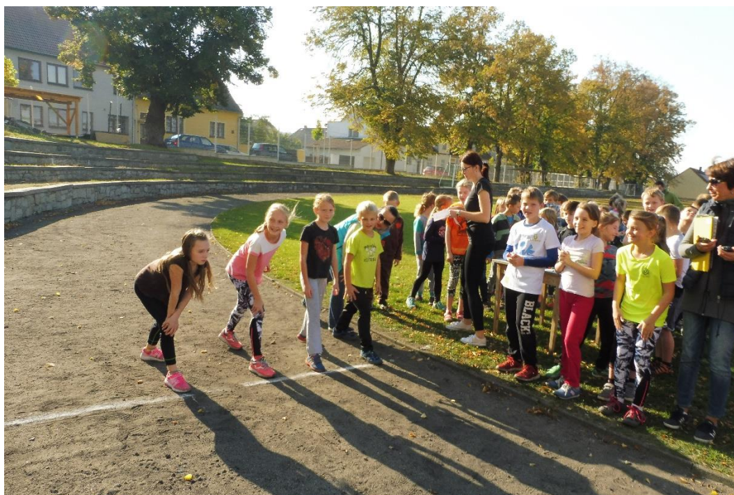
Štafeta E. Zátopka