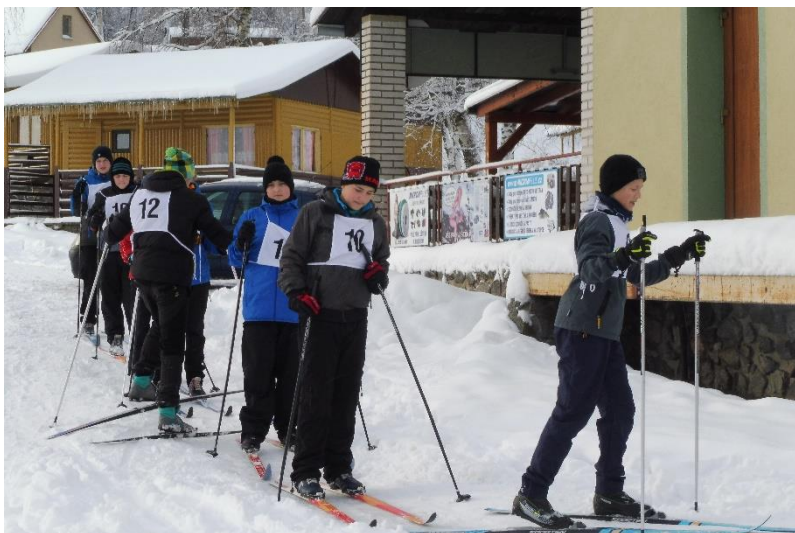
Lyžařský kurz na Řásné